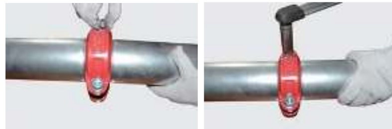
Рис.3. Грувлочное соединение гибкой муфтой.